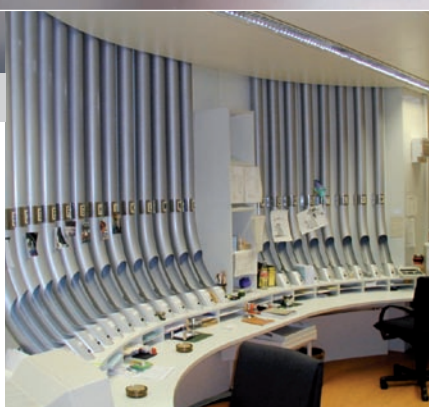
Impianti di posta pneumatica nelle Banche