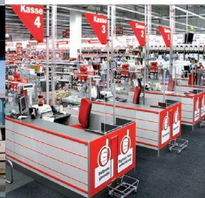
Impianti di posta pneumatica nei supermercati