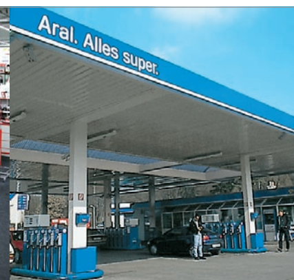
Impianti di posta pneumatica per stazioni di servizio