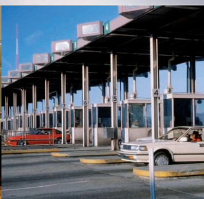
Impianti di posta pneumatica per caselli autostradali